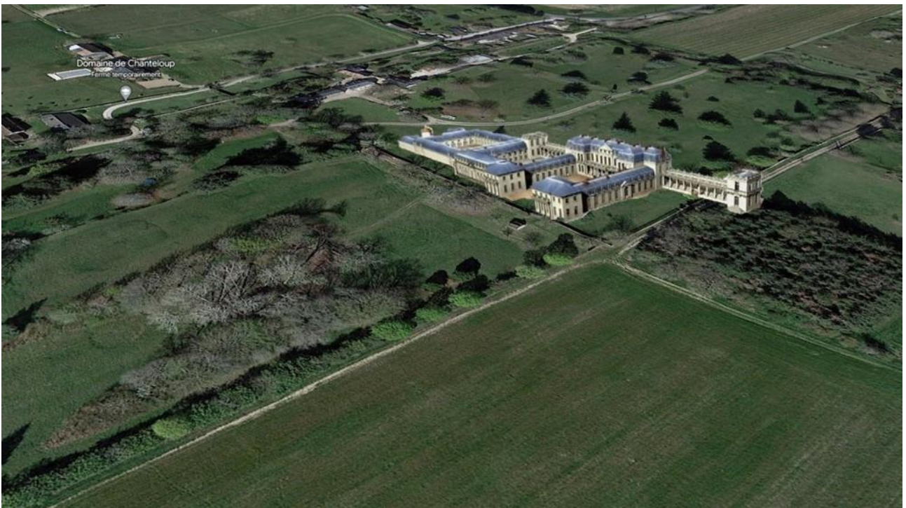
Reconstitution 3D sur perspective existante